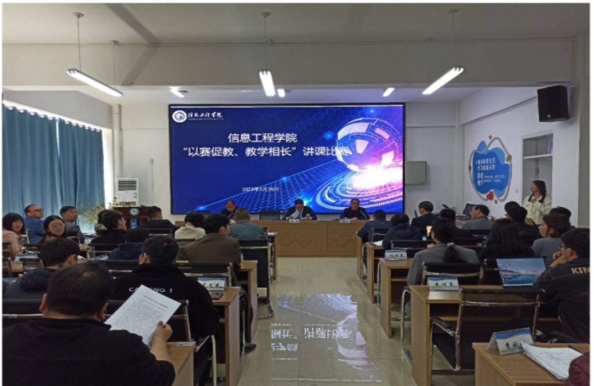
图4 助教安排表和教学相长讲课比赛