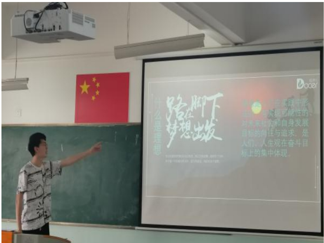
图 5 学生在课堂演讲“什么是理想”

徐新萍老师，《思想道德与政治》，面向土木 22-[3-4]班。103 人。徐老师本次实践课，主题是：我的理想。学生以小组为单位事先准备了 ppt，然后在课堂上演讲，老师适当点评，同学之间互相点评，课堂气氛比较活跃。学生以“名人榜样经历->理想的定义->找寻自己的理想->如何为理想奋斗”为思路，讨论自己的理想，有的认为“世上最快乐的事，莫过于为理想而奋斗”，有的认为“脚下有大地，心中有理想”，有的认为“星光不负赶路人，你总会发光”。徐老师引导学生，将理想和努力的种子一点点埋入同学的心田，总有一天会发芽。是一次比较成功的实践讨论课。